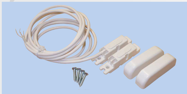
provedení s kabelem (21-K)